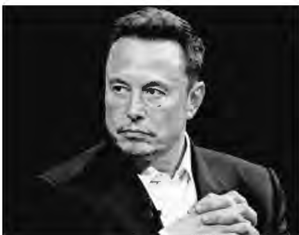
Elon Musk, who owns X, has posted more than 3,000 times on the site in the last month

Musk and X did not respond to requests for comment. Last month, Musk posted that X products were the "best thing on the Internet for truth."